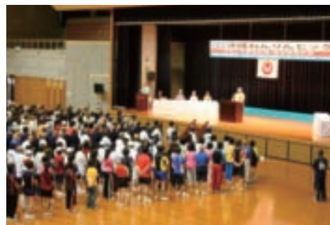
▲昨年度の総合開会式の様子

高齢者に適したスポーツ、文化活動等を通じて健康の保持・増進と参加者相互の交流を図り、生きがいと健康づくりを進めることにより、明るく活力あふれる長寿社会づくりの促進に寄与することを目的に平成22年9月24日(金)から26日(日)までの3日間、奥武山総合運動公園を主会場に、県内各会場において18競技が開催されます。この大会は、次年度開催される「第24回全国健康福祉祭くまもと大