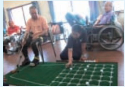
▲囲碁ボールを楽しんでいる様子

毎月、3～4種程のニュースポーツが体験でき、とても充実した余暇活動が過ごせています。また、職員・他者と楽しく交流が図れることと、リハビリの一環として運動に取り組めることが何よりです。